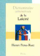
*Auteur du Dictionnaire amoureux de la laïcité, éd. Plon. Prix national de la laïcité en 2014.

La laïcité n'est pas antireligieuse. Lutter contre les privilèges publics des religions, ce n'est pas lutter contre les religions elles-mêmes. Victor Hugo, poète croyant et laïque, disait en ce sens : « Je veux l'État chez lui et l'Église